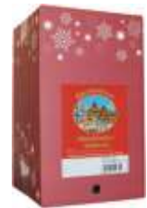
Bacchusfeuer Christkindles Glühwein