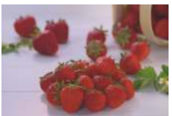
Melzer Erdbeeren "Senga"