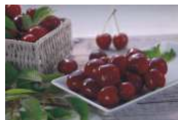
Melzer Sauerkirschen entsteint