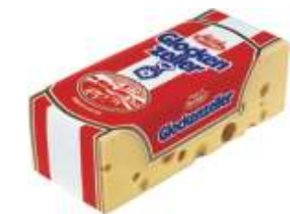
Zott Glockenzeller 45%