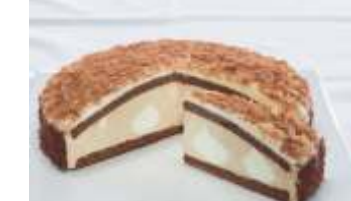
Pfalzgraf Latte-Macciato Torte