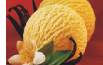
Carte D'or Bourbon Vanille

mit feinen Bourbon-Vanilleschoten 5 Liter