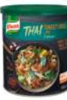
Knorr Thai Sweet Chilli Jam

Süß-scharfe Würzpaste für Thai- Gerichte 920g