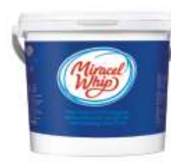
Kraft Miracel Whip