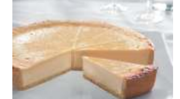
Pfalzgraf Rahmkäsekuchen mit Rosinen