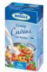
Meggle Creme Cuisine