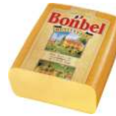
Bel Bonbel 50%