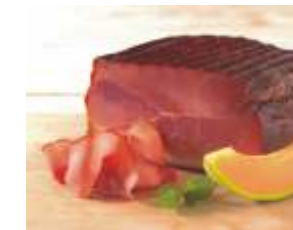
Tannenhof Schwarzwälder Kernschinken

Über Tannenreisig trocken gepökelter Schwarzwälder Schinken ca. 1,6kg Stück