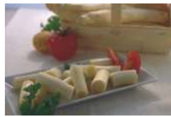
Melzer Stangenspargel weiß