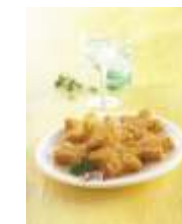
Schne-frost Rösti Sterne