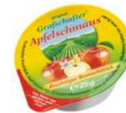
Hellma Grafschafter Apfelschmaus

ein Brotaufstrich, der aus frisch geernteten Äpfeln und einem kleinen Teil Birnen mit Hilfe eines besonders qualitätsschonenden Verfahrens hergestellt wird. 80x25g im Karton