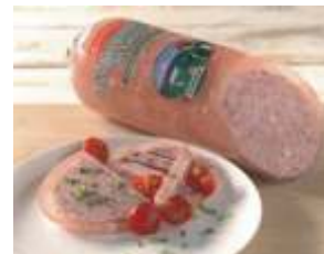
Tannenhof Vespermett im Geleemantel