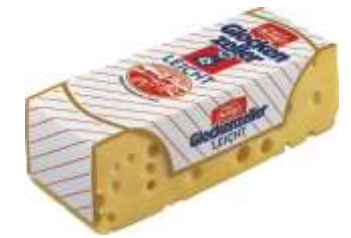
Zott Glockenzeller 30%