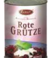
Lukull Rote Grütze