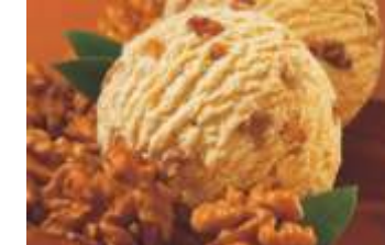
Carte D'or Walnuss

reich durchsetzt mit karamellisierten Walnußstückchen 5 Liter