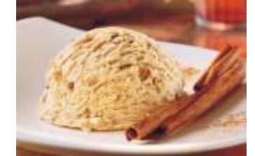
Carte D'or Zimt

Unvergleichlich zart schmelzende Kreation aus Zimteiscreme, vollendet mit knusprigen Zimt- Karamellstückchen. 2,4 Liter