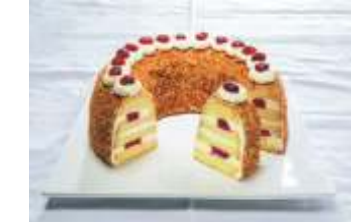
Pfalzgraf Frankfurter Kranz