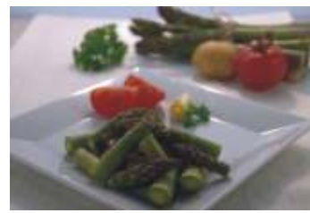
Melzer Stangenspargel grün