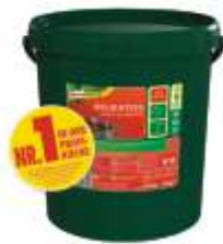
Knorr Delikatess Sauce zu Braten

Universell einsetzbar Instant Ergiebigkeit 108,5 Liter 10kg Eimer